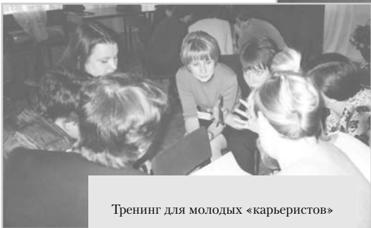
Тренинг для молодых «карьеристов»

творческую позицию, партнерские отношения внутри коллектива, направленные на развитие всей библиотеки. Одна из ступеней этой работы - формирование потенциала для реализации деловой карьеры, которая обеспечивает развитие индивидуальности личности работающего, необходимой для решения стратегических