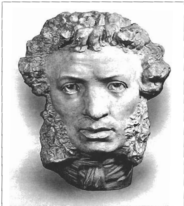
А.М.Онекушин. Этюд головы для памятника Пушкину в Москве. 1880

рода эмансипацию русского угнетенного чувства? Не казалось ли им, что они точно возвращаются, после долгой где-то отлучки, на родину, домой, домой!..