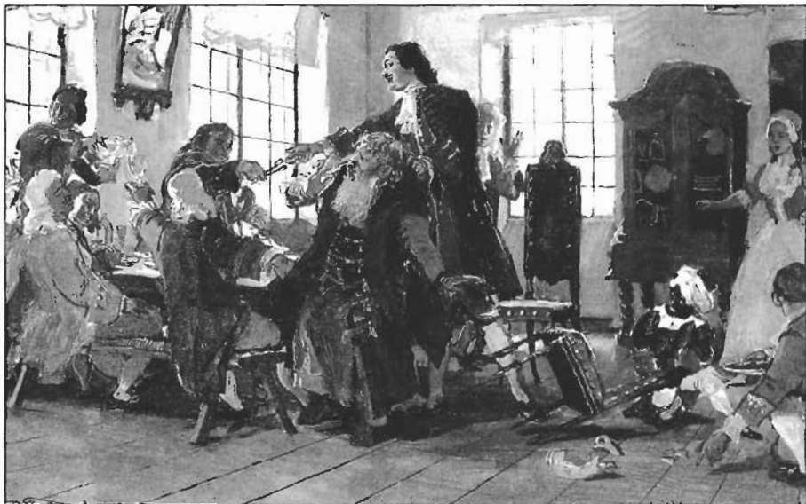
Петр I стрижет бороды боярам. Худ. Д.Белюкин. 1985

В 1819 году в торжественном заседании нашего же Общества любителей российской словесности и в этом же самом зале рассуждалось «о господине Буало и гении Корнеля, сих вечных образцах искусства». Расширяя, однако, число образцов и поприще для русской литературы, ученый, достойный всякого уважения, председатель общества