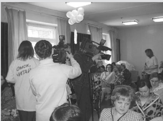
Телесъемка презентации акции «Компетентная мама»

Используя свои ресурсы, креативные решения, стратегический подход, молодые специалисты муниципальных библиотек намерены адресно продвигать книгу к читателю и позиционировать чтение среди омичей как необходимое условие достижения нового качества жизни и становления личности.