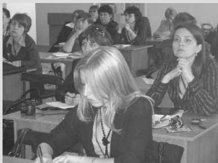
Участники заседания секции РБА «Молодые в библиотечном деле». Ульяновск, 18 мая 2008 г.