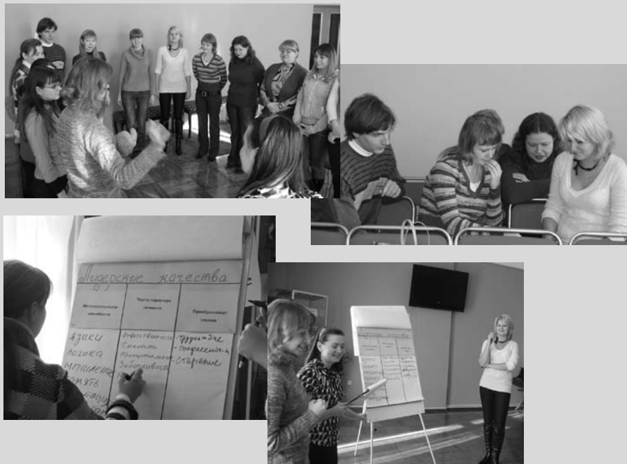
Рабочие моменты местных, зональных семинаров, тренингов, деловых игр

венно, с ними проводится определенная работа для адаптации в библиотеке и библиотечной профессии.