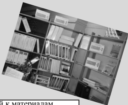
Статистика обращений к материалам ОВОС сахалинских проектов