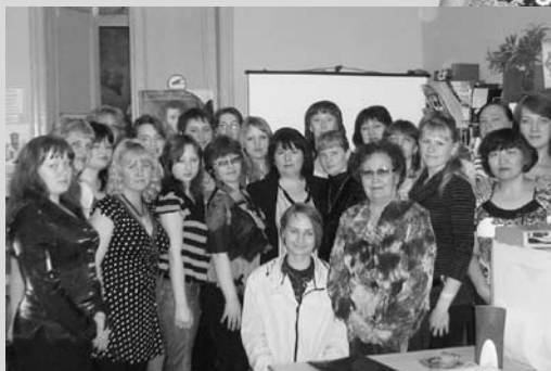
Участники курсов повышения квалификации молодых библиотекарей

в областном конкурсе культурных и социальных проектов общественного фонда «Саратовская губерния» с проектом «Страна Саратовия».