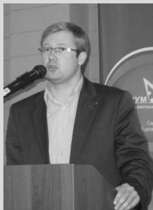
Выступление Д.В. Фадеева, председателя комитета по физической культуре, спорту, туризму и делам молодежи Саратовской областной Думы

Становится хорошей традицией приглашать на юбилей библиотек библиотечную молодежь страны. Саратовцы поддержали и развили эту тради-