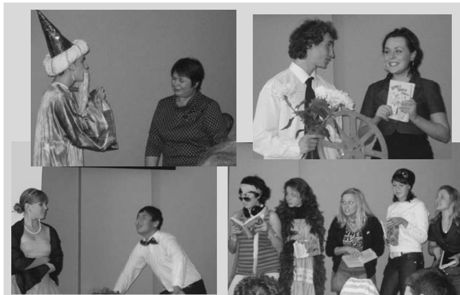
Капустником «Огней так много золотых...», подготовили студенты Саратовского областного колледжа культуры им. Е.Н. Курганова, под руководством Б.Л. Маклярской

Очень насыщенный докладами, профессиональным общением день был завершён капустником « Огней так много золотых ... », подготовленным специалистами Саратовской областной библиотеки для детей и юношества под руководством Б.Л. Маклярской совместно со студентами-волонтерами Саратовского областного колледжа культуры им. Е.Н. Курганова. Капуст-