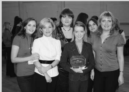
Переходящий символ Форума в руках молодых