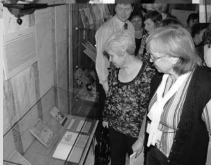
Участники Форума знакомятся с экспозицией «90 лет служения читающей губернии»

ребят и сотрудников библиотеки. Дорогой боец, шлем тебе скромный подарок. Бей, пожалуйста, лучше немцев!» Это написал ученик 5 класса.