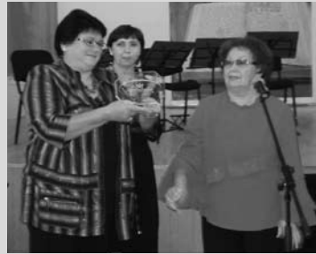
Торжественную церемонию закрытия Форума венчала неизбежная и волнующая акция передачи символа Форума