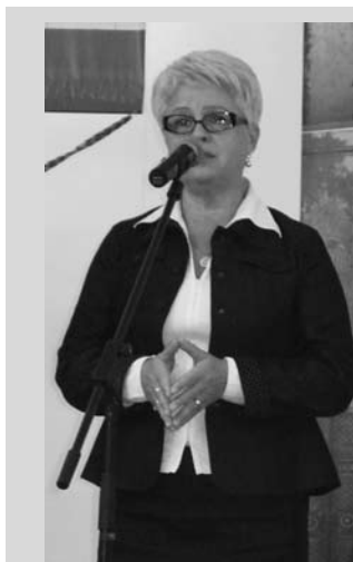
С приветствием к участникам Форума выступила Н.И. Старшова, заместитель Председателя Правительства Саратовской области