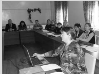
Рабочие моменты заседания