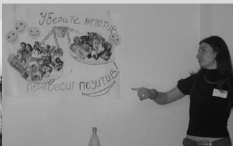
Проведение мастерской «Здоровая идея — это здорово!»