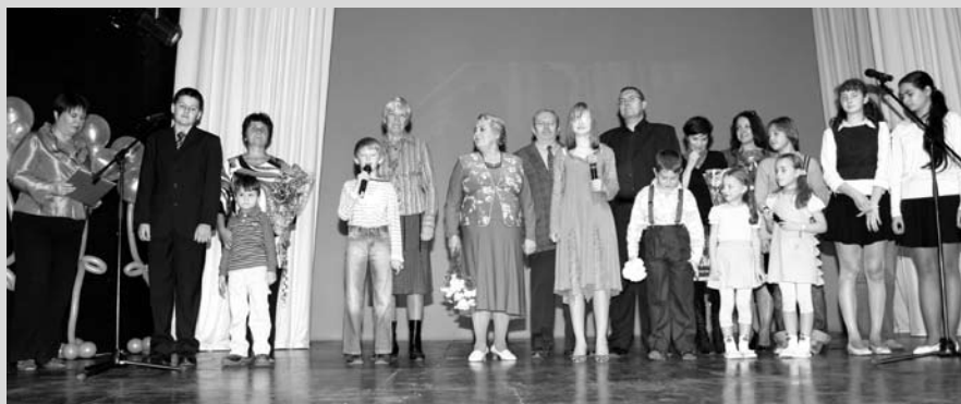
Юбиляров поздравляют читательские династии Пушкинки

ного коллектива, лауреата многих международных конкурсов — цирка «Арт-Алле» из г. Маркса Саратовской области.