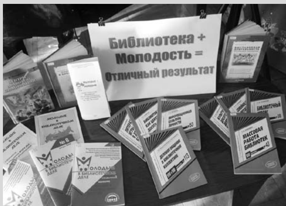
Выставка — информационная поддержка каждого мероприятия молодых