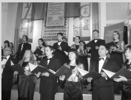
В церемонии торжественного открытия III Форума молодых библиотекарей России принял участие Саратовский губернский театр хоровой музыки под руководством заслуженного деятеля искусств России, профессора Л.А. Лицовой

«Несмотря на трудности последнего года, у нас более 1000 библиотек в области сохранено, в них работают почти 2,5 тысячи сотрудников. Более половины имеют высшее и среднее специальное, именно библиотечное образование. Это проверенные жизнью и сложными временами люди. Решаются, конечно, и вопросы оплаты труда. С января этого года мы перешли на новую систему оплаты труда в бюджетной сфере. Конечно, заработная плата больше выросла в сфере образования и медицины, но и в культуре... Буквально год назад наши библиотечные работники получали зарплату ниже 4,5 тысяч