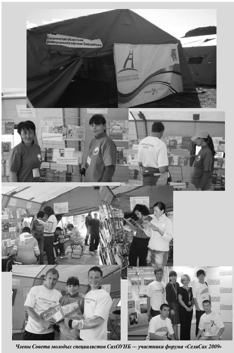
Члены Совета молодых специалистов СахОУНБ — участники форума «СелиСах 2009»