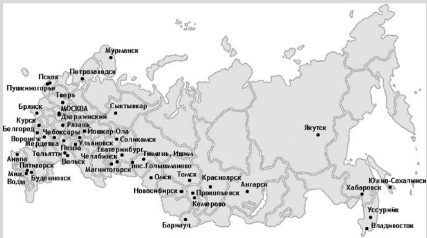
География мероприятий молодежного библиотечного движения 2009 года

мероприятия, такие как Республиканский форум молодых библиотекарей, Зональные встречи молодых библиотекарей, но и сельские библиотеки, проводя заседания Клубов молодого библиотекаря, Школы молодых библиотекарей.