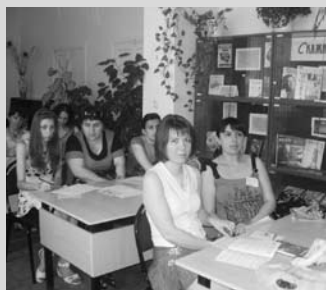
Рабочие моменты Школы молодых библиотекарей

Работу Школы открыла конференция «Стиль жизни — здоровье», цель которой — обсуждение проблем формирования здорового образа жизни населения как важного показателя общественного развития, определяющего экономический, трудовой, демографический, культурный и духовный потенциал общества и региона. В мероприятии участвовали представители учреждений образования, культуры, здравоохранения, молодежных и общественных организаций края, в том числе: руководитель краевого Центра медицинской профилактики, управляющий делами Уполномоченного по правам человека в Ставропольском крае, вице-президент межрегионального благотворительного фонда «Выбор», специалисты Пятигорского отделения «Российского Красного Креста», директор НП «Институт социальных перспектив», руководитель Межрегионального центра международного общественного фонда «Российский фонд мира» в Южном федеральном округе, специалисты министерства по делам молодежи Республики Кабардино-Балкария.