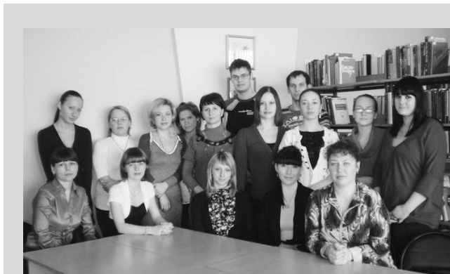
Молодежный Совет СахОУНБ

областной целевой программы «Электронный Сахалин» (2008-2010 гг.), которая была разработана на основании федеральной целевой программы «Электронная Россия (2002-2010 гг.)» по заказу Администрации Сахалинской области. Отличие от федеральной программы состоит в том, что программа «Электронный Сахалин» предусматривает активное участие библиотек. Это радует, так как стимулирует инновационное развитие библиотек области.