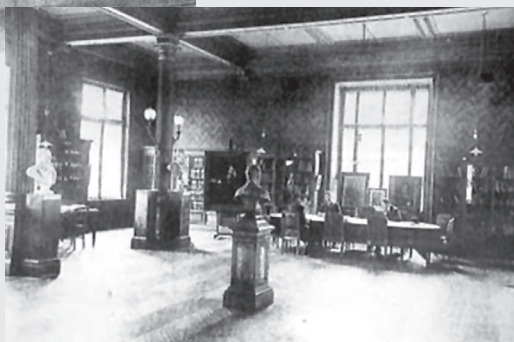
Библиотека пастеровского института, г. Париж

В 1883 г. Мечников сделал доклад «О защитных силах организма», в котором изложил свои взгляды на иммунитет и защиту организма от чужеродных микроорганизмов. Проведя огромное количество экспериментов, он обнаружил в крови животных и человека особые защитные клетки, которые назвал фагоцитами («фагос» — пожирающий и «цитос» — клетка). За это открытие он совместно с П. Эрлихом в 1908 г. получил Нобелевскую премию.