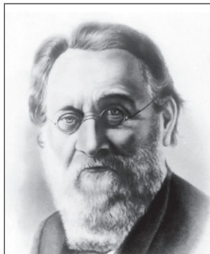
Илья Ильич Мечников (1845-1916)

Мечников никогда не занимался политической деятельностью, но после покушения в 1882 г. на Александра II, когда усилилось давление на университетских сотрудников, он был вынужден покинуть кафедру и стал работать дома. Вместе с Н.Ф. Гамалеей он изучал такие инфекционные заболевания человека и животных, как туберкулез, чума, бешенство. В результате их деятельности была создана первая в России бактериологическая станция, на которой делались прививки от бешенства.