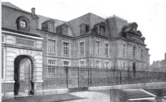
Здание Пастеровского института, г. Париж