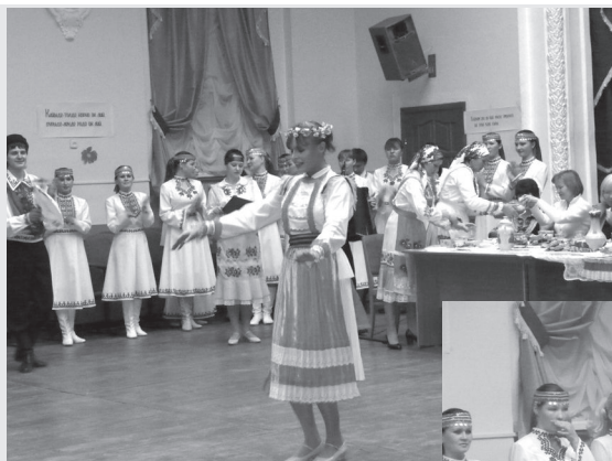
Праздник «Девичьи посиделки»