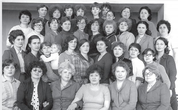
Коллектив библиотеки 1973 г.