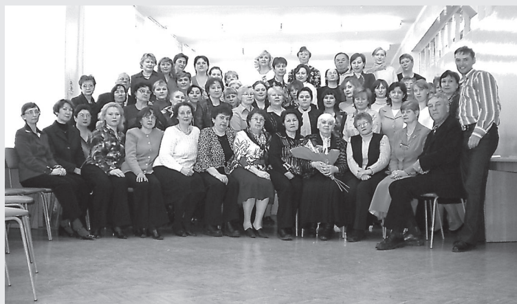
Коллектив библиотеки 2005 г.

Итог ее созидательной деятельности – библиотека первой категории, научно-методический центр библиотек вузов и ссузов Республики Марий Эл. Фонд – свыше 1100 тыс. экземпляров, штат – более 100 высокопрофессиональных специалистов. В библиотеке работают: выставочный зал с сектором краеведения; центр информационной поддержки образования, партнером которого является Министерство образования Республики Марий Эл; информационный центр Евросоюза; компьютерные технологии, в том числе работа в корпоративной сети МАРС; комплексный отдел на юридическом факультете со статусом Государственно-правовой библиотеки Президента Республики Марий Эл с функциями депозитарной библиотеки ООН.